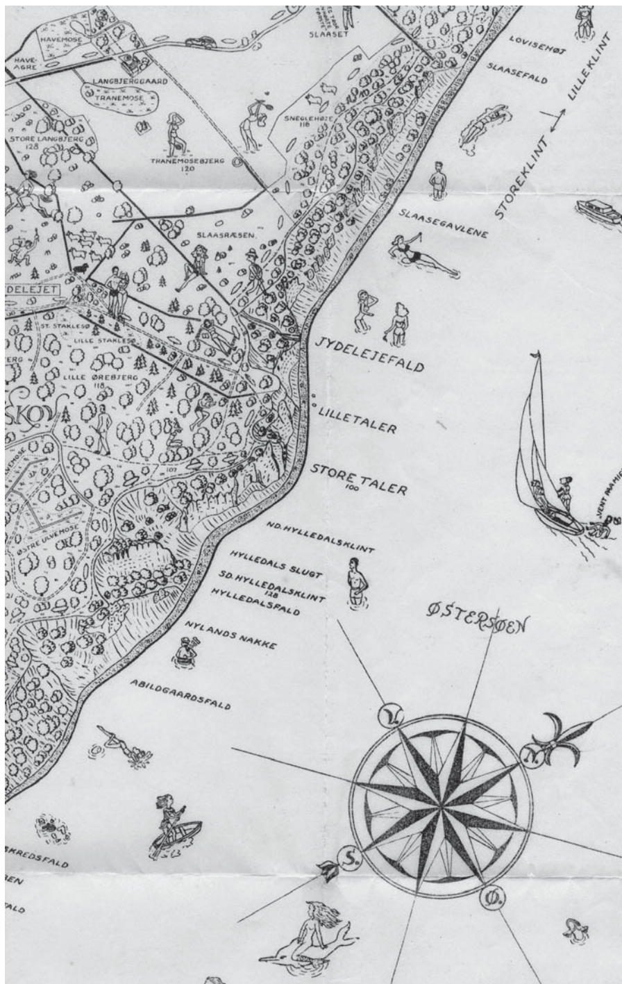
Figur 2. Fra Turistkort Møns Klint 1947, 1: 10.000. Indscannet af N. C. Nielsen, SDU.

Det videre forløb i projektet Imidlertid har eftersøgningen af