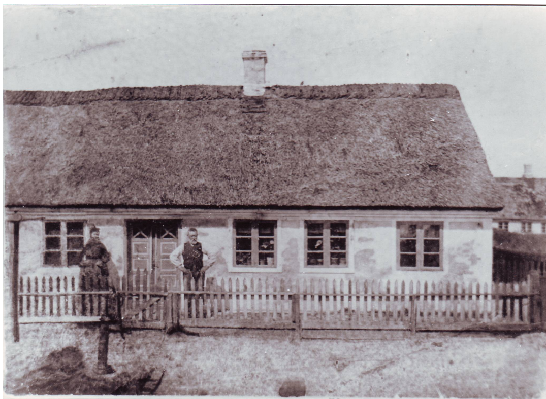
Matr. nr. 101a. Kropladsen 20. Foto i Sønderho Sognearkiv B00151_014.

110 Hans Nielsens Jense et Fæste brev udsted af Amptsforvalter Bruuhn / af Dato 9 Octobr 1720 paa Hans Huus Byggested Bredselsrum og Kaaljord / samt noget Iord i Tøftløs bestaaende af 6 Stycker, Noget Øvr. jord i / Østre Kaaberdal bestaaende af 7 Stycker,