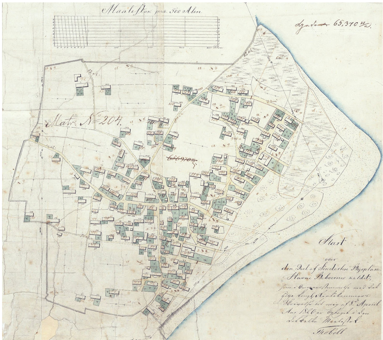
Sønderho 1820. Tegnet af landinspektør Thobøll. Kortet er det tidligste af Sønderho og er baseret på en opmåling med henblik på den første matrikulering af Sønderho. Husenes retning og omtrentlige størrelse fremgår klart af kortet. Vesterland, som ikke er med, er netop omkring tidspunktet for dette kort under udbygning.

Det fremgår ikke klart, hvornår jordbogens realregister er påbegyndt – og afsluttet – men skriftundersøgelser kombineret med datering af senere ejerskifter indikerer, at det må være påbegyndt efter 1750 og afsluttet før 1760.