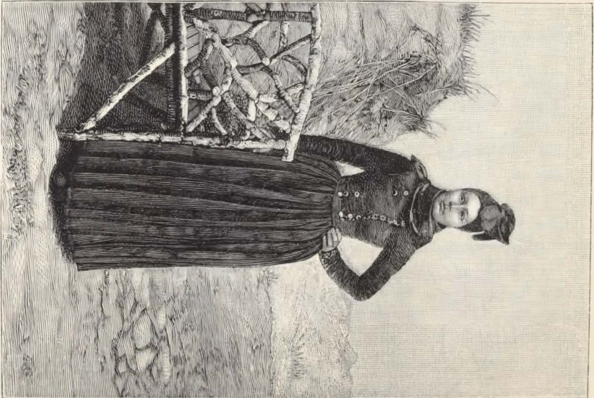
Fanøpige i Nationaldragt.