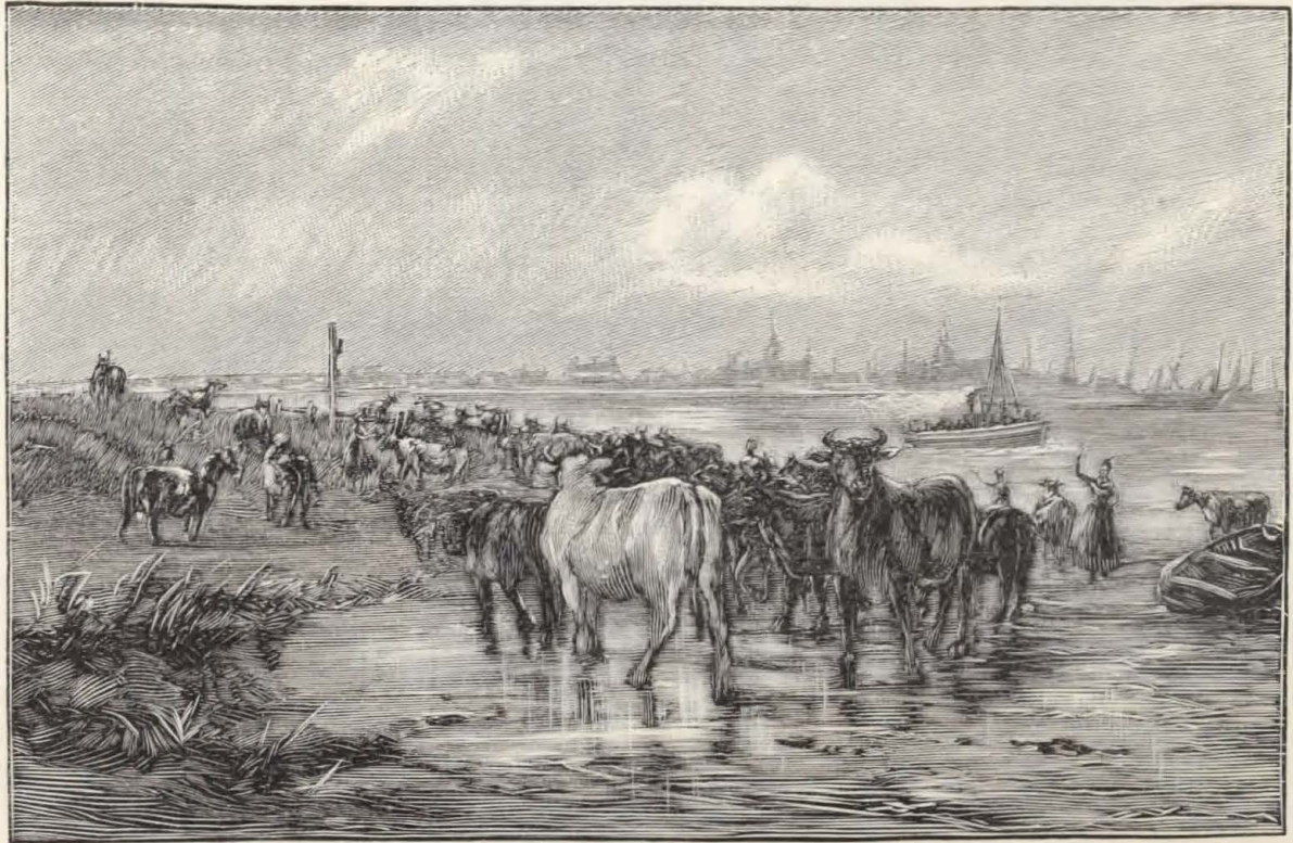
Køerne drives hjem.