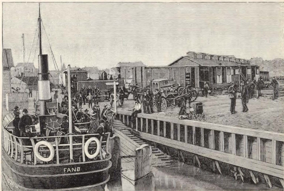
Fanø Damperens Afgang fra Esbjerg.