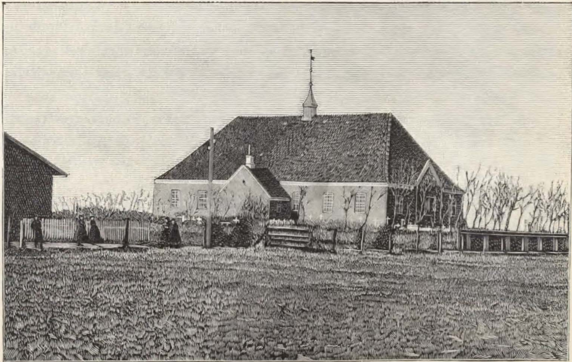
Kirken i Nordby.